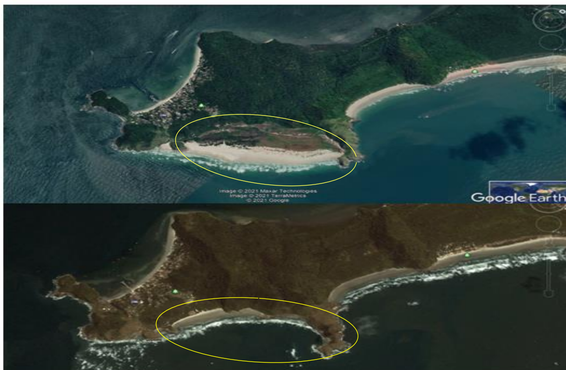
Imagem 4: processo de assoreamento da Praia do Mar de Fora de Encantadas apontado pelo círculo amarelo.

Também sofremos a diminuição e até o desaparecimento de algumas espécies de peixes antes pescados e comercializados. Pode-se dizer que, as antes abundantes espécies de mariscos, guaiás, caramujos e lagostas não mais são encontrados. Também os costões da nossa ilha foram atingidos pelas dragagens que acabaram por cobrir de areia as tocas de vários tipos de peixes.