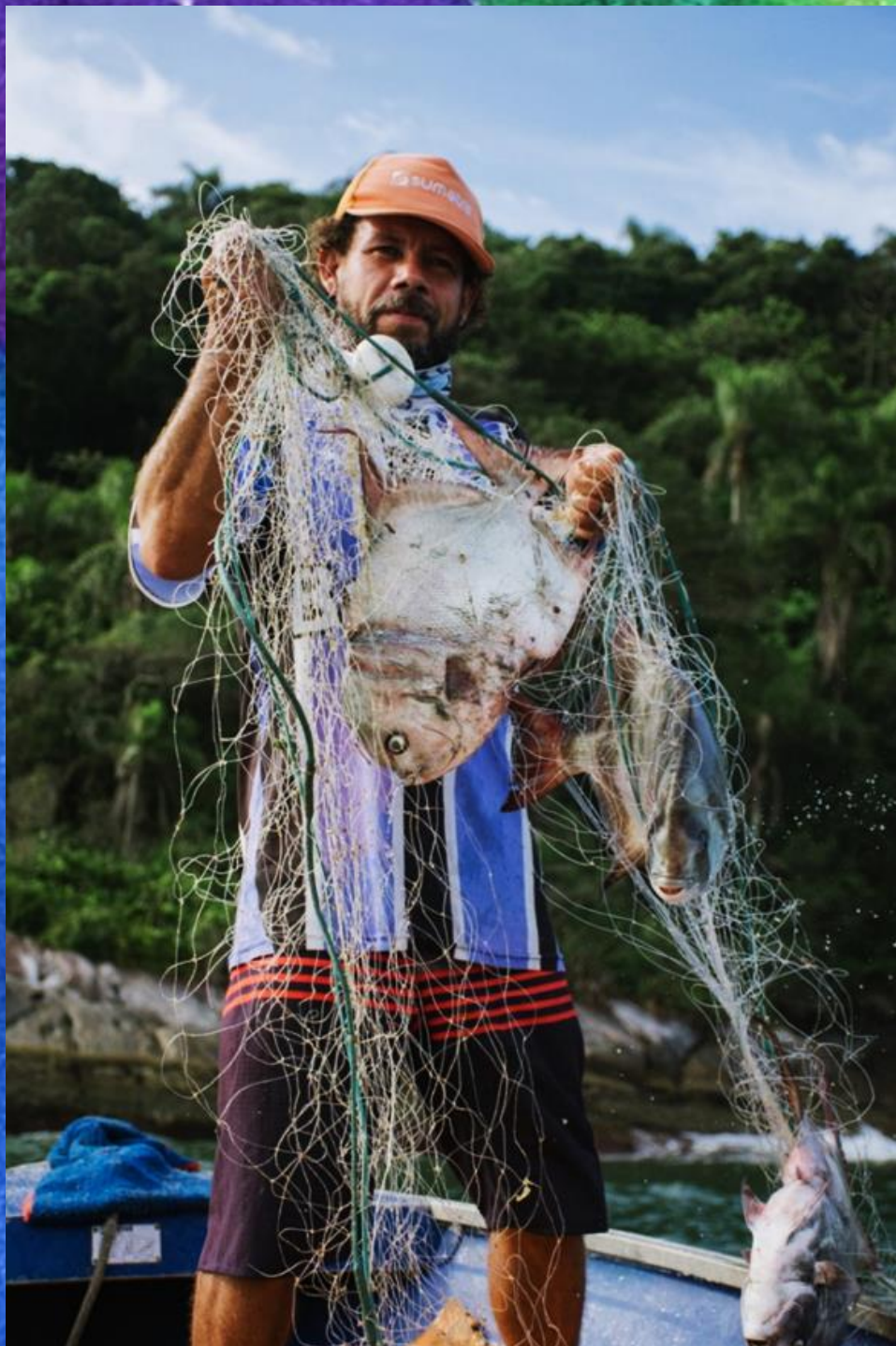
Imagem 1: Pescaria tradicional na ilha do Cará.