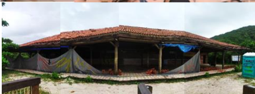
foto 3; a Praça de alimentação em 2021, após 3 anos de interdição pelo governo do Paraná.

foto 2: a Praça de Alimentação nos anos 2000, com turistas em nossos boxes administrados por nossas famílias;