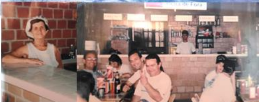
foto 2: a Praça de Alimentação nos anos 2000, com turistas em nossos boxes administrados por nossas famílias;

foto 1: nossos bares na praia do Mar de Fora nos anos 90;