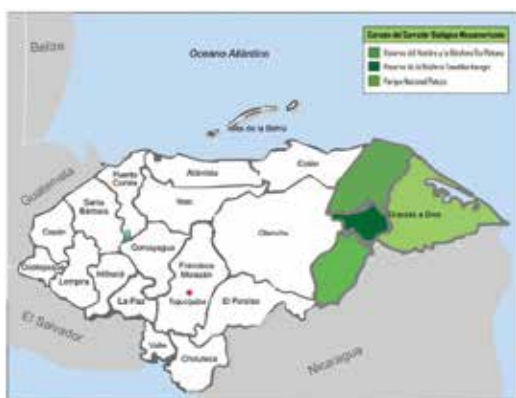
Ilustración 1. Departamentos de Honduras

En 1957, la controversia territorial sostenida entre Honduras y Nicaragua por el ejercicio de la soberanía nacional respectiva, dio lugar a un reordenamiento territorial de La Muskitia hondureña. El conflicto se concretó en la creación del Departamento de Gracias a Dios; y en el envío de contingentes militares a diversas áreas de La Muskitia. Desde entonces, las fuerzas militares hondureñas se constituyeron en una representación permanente del Estado en La Muskitia.