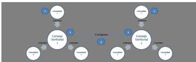
Ilustración 4. Los 3 diferentes niveles de consenso

Si sólo se ve afectada una comunidad por un proyecto, es suficiente otorgar el consenso de esa comunidad. Si varias comunidades están afectadas por un proyecto, el consenso se tiene que establecer entre las diferentes comunidades en una asamblea a nivel de Consejo Territorial. Si comunidades de diferentes Consejos Territoriales están afectadas, todos los Consejos Territoriales involucrados tienen que llegar a un consenso. El consenso se establece por lo tanto en los Consejos Territoriales, que a su vez informan a la Junta Directiva de MASTA.