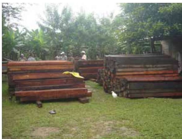
Madera decomisado con permiso adulterado por AFE-COHDEFOR, 2,006

Las instituciones gubernamentales creadas para la protección y conservación de los recursos naturales, tales como la Administración Forestal del Estado-Corporación Hondureña de Desarrollo Forestal (AFE-COHDEFOR) anteriormente, ahora ICF, la Dirección General de Pesca y Acuicultura (DIGEPESCA), y la Secretaría de Recursos Naturales y Ambiente (SERNA) no ejecutan su mandato en la Mosquitia. Además le han quitado las potestades a la población Indígena, lo que ha representado en el incremento del uso y comercialización ilegal de los recursos, situación en la que se han visto involucrados de las instituciones antes mencionadas.