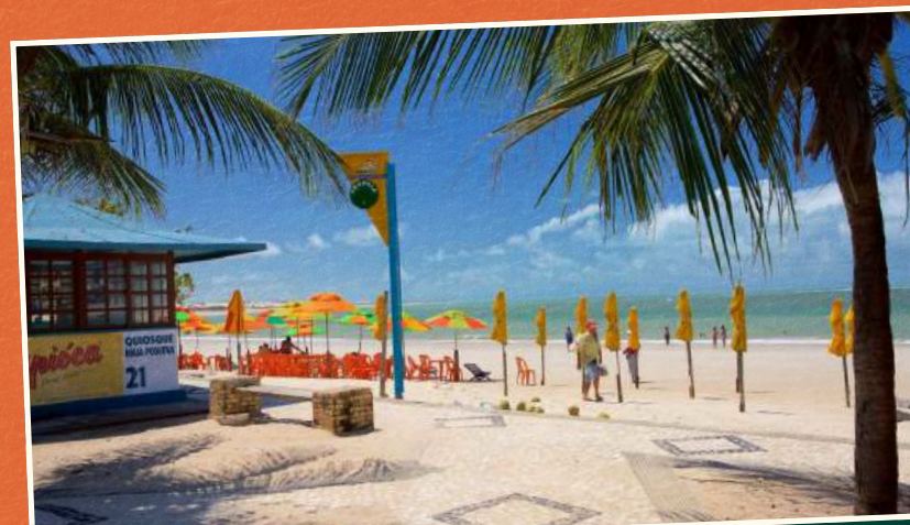
Quiosques da Redinha em 2021