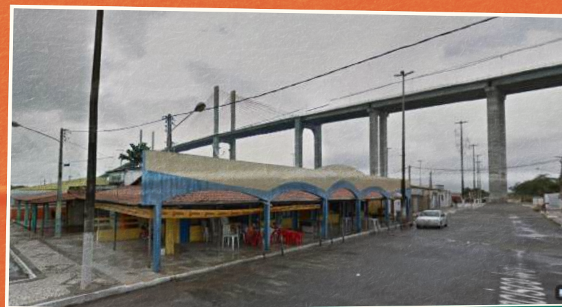
Mercado Público da Redinha em 2021

Em 1949, foi fundado o Mercado Público da Redinha, às margens do Rio Potengi, e se destaca pela sua gastronomia típica com pratos de peixes e frutos do mar abastecidos pelos pescadores locais. Desde então, o mercado concentra trabalhadores em torno da atividade de pesca e serviços de turismo e gastronomia na praia dinamizando a microeconomia local.